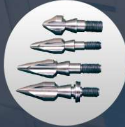
ROKET TAKIMI ROCKET SETS