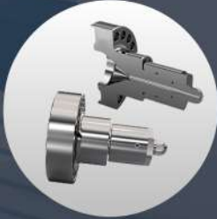
MEME TAKIMI NOZZLET SETS